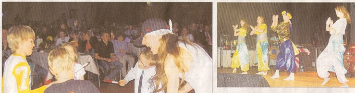
Der Carnevalverein aus Quedelburg sorgte mit vielen tollen Kostümen für Abwechslung und Unterhaltung.